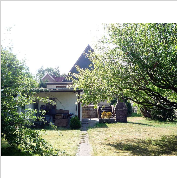
Wohnen im Grünen!